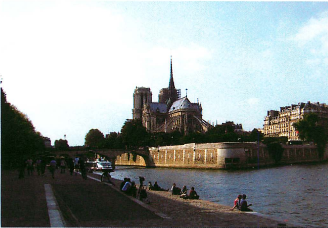
セーヌ川とノートルダム寺院